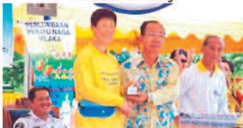
L'équipe féminine de Falun Dafa à l'occasion du championnat du Bateau dragon reçoit un prix.