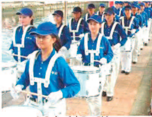
La Fanfare de la Terre Divine